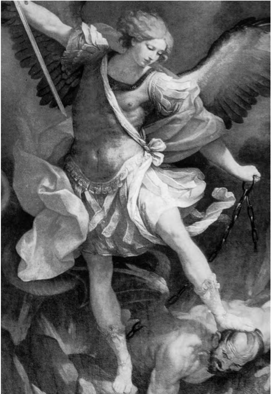
Heiliger Erzengel Michael, bewahre uns vor Sünde und Schuld.